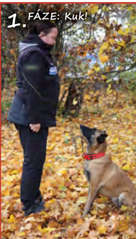
Základem je, že pes už spolehlivě ovládá sedni–zůstaň. Takže psa posadíte před sebe a upoutáte jeho pozornost tím, že zamlaskáte, nebo uděláte podobný zvuk.