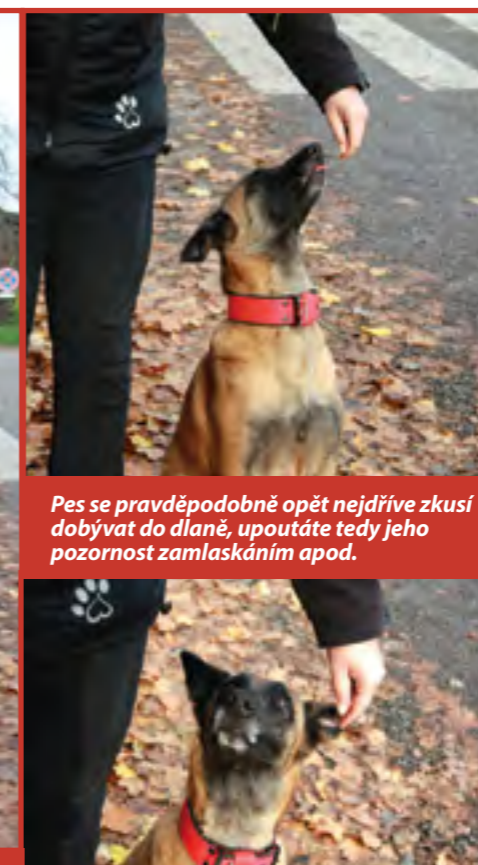
Pes se pravděpodobně opět nejdříve zkusí dobývat do dlaně, upoutáte tedy jeho pozornost zamlaskáním apod.