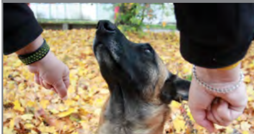
V tu chvíli zamlaskáte (nebo jiným zvukem upoutáte jeho pozornost). Jakmile se vám pes podívá do očí, opět následuje povel „kuk!“ a okamžitá odměna.