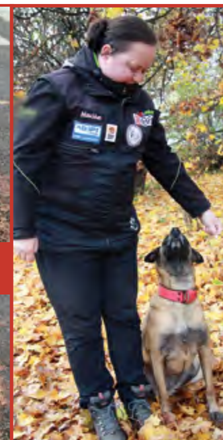
Následný pohled do očí (doprovázený povel „kuk!“) hned odměňujte. Ideální stav je, když z vás pes doslova „nespuští oči“.