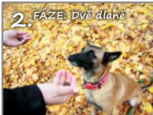
Pes opět sedí před vámi, vezmete pamlsky do obou rukou. Dlaně dáte vedle hlavy psa.