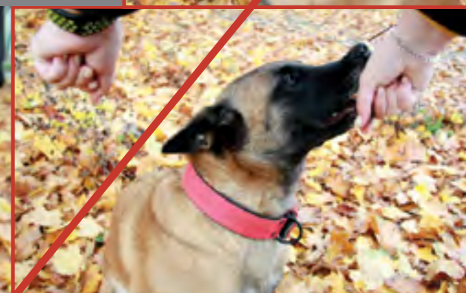
Pes se nejprve (a v podstatě okamžitě) začne do dlaní dobývat – to je běžné, na začátku to udělá úplně každý pes! Důležité je, aby to už neopakoval.