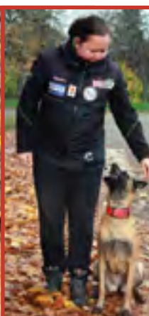
Tím se naučí vás nepřetržitě sledovat a vy máte jistotu, že vám nikam neutěče a budete ho mít neustále pod kontrolou.